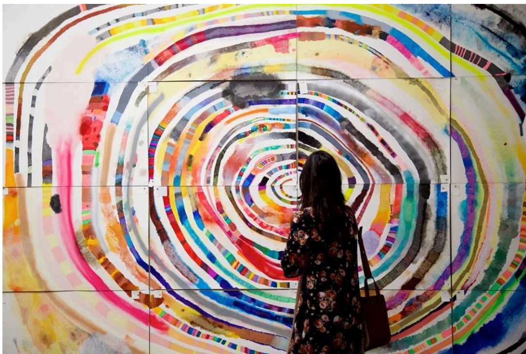
Obra no ateliê da artista, São Paulo - SP, 2017